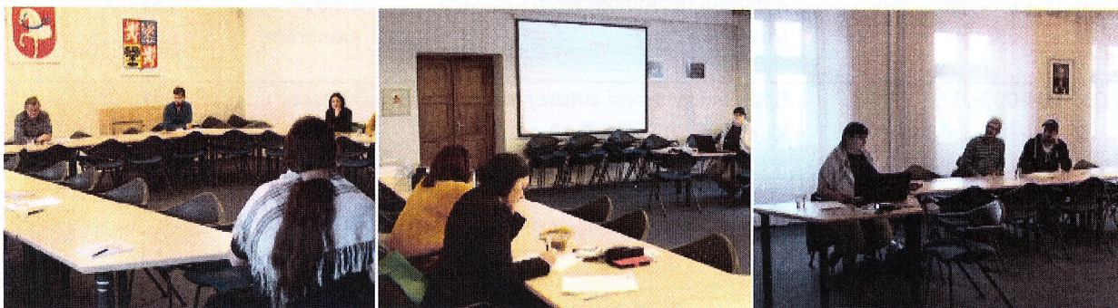
Foto ze semináře

Detailní informace pro řádnou přípravu a podání projektů byly v průběhu celé výzvy zveřejněny na webových stránkách http://www.mashlinecko.cz a v kanceláři MAS mohl každý zájemce získat další potřebné informace či si sjednat osobní konzultaci ke svému projektu. Pro zájemce, kteří se chystali po prostudování výzvy podat svůj projekt, proběhl 19. 2. 2020 v Hlinsku na městském úřadě podrobnější seminář, kde mohli všichni přítomní získat informace a rady k vyplnění žádosti, doložení příloh a sepsání projektu.